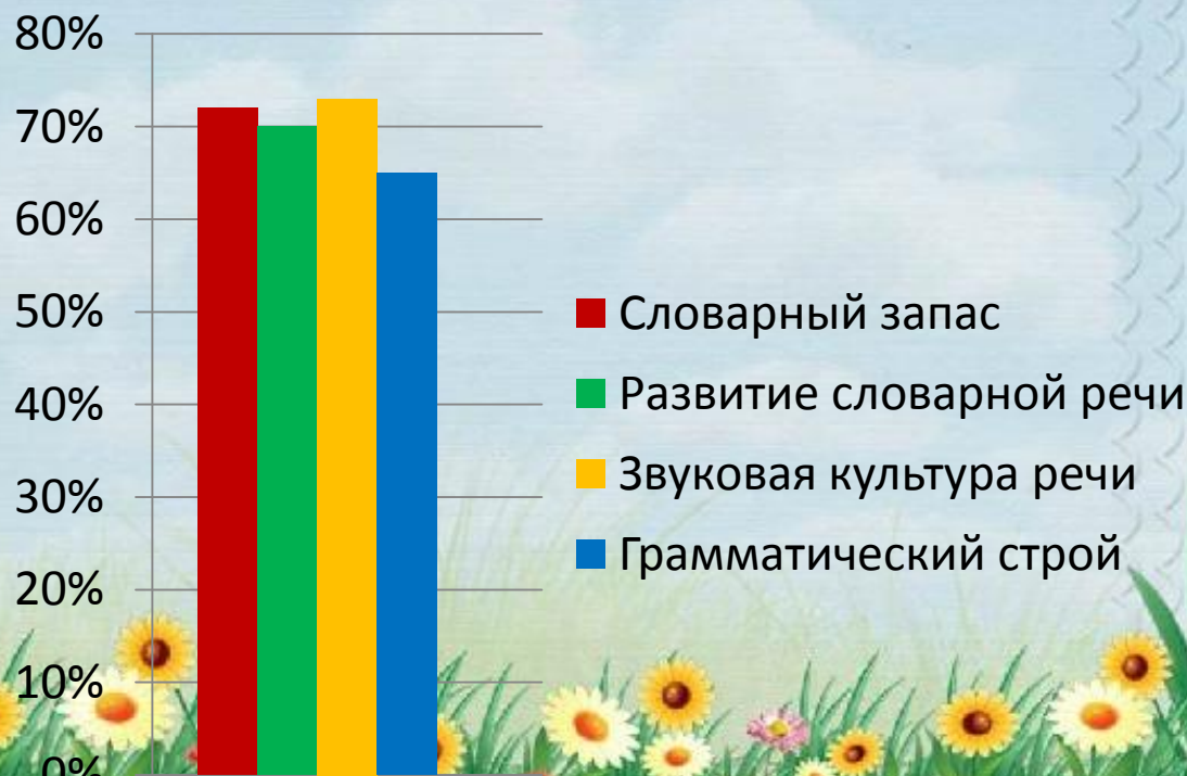
Диаграмма на начало года

Проблема речевого развития детей дошкольного возраста на сегодняшний день очень актуальна, т.к. процент дошкольников с различными речевыми нарушениями остаётся стабильно высоким.